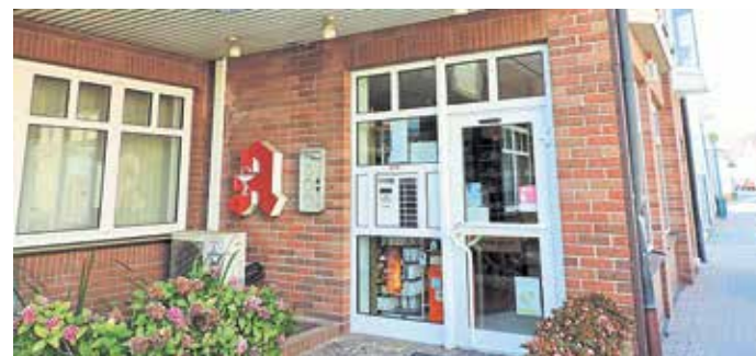
Harheim-Apotheke, Alt-Harheim 7.