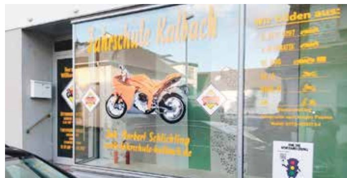
Die neue Filiale in der Talstraße 11 in Kalbach.