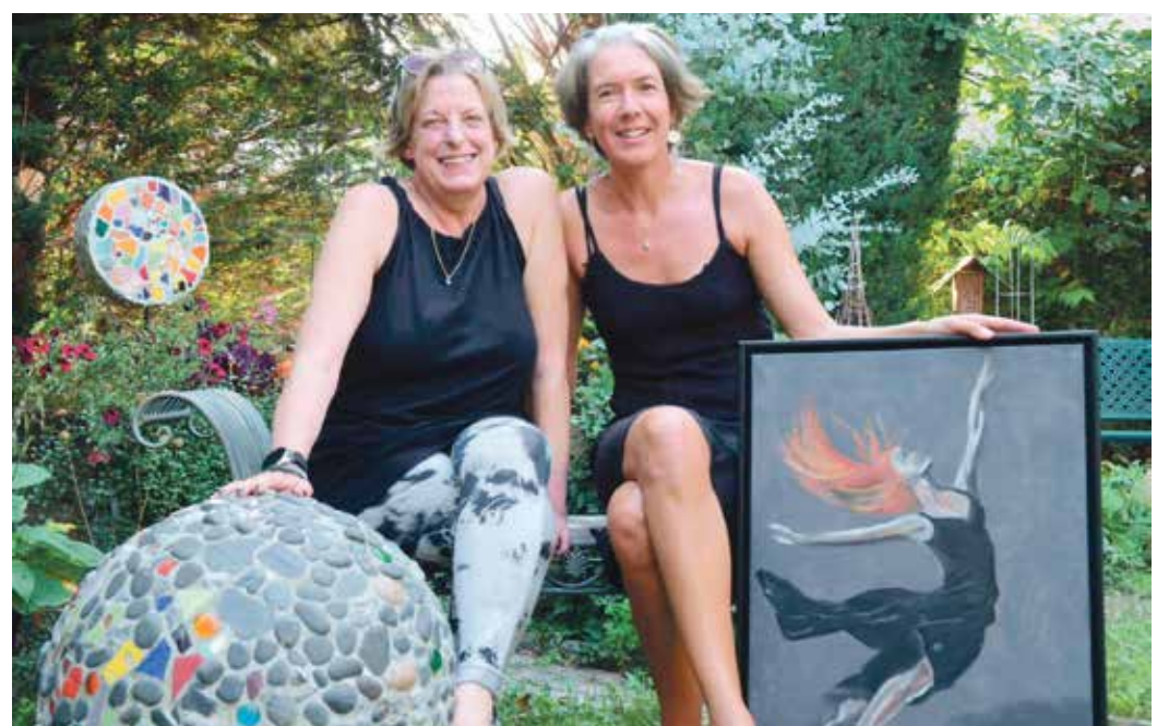
Die Künstlerinnen präsentieren zwei Werke als kleinen Vorgeschmack.

Die zwei Künstlerinnen ergänzen sich sehr gut und der Ausstellungsort bietet eine idyllische Atmosphäre, bei der Kunst be-