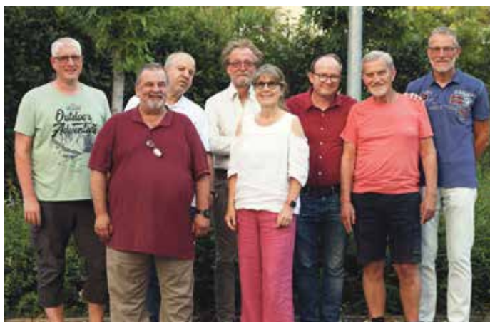
Die Nominierten der SPD Nord-Ost.

FRANKFURTER NORDEN • Die Sozialdemokratinnen und Sozialdemokraten aus Berkersheim, Bonames und vom Frankfurter Berg haben ihre Liste für die kommende Ortsbeiratswahl aufgestellt.