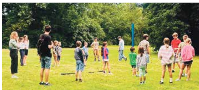
Die Kinder bei den Highland Games.

Ein actionreicher Höhepunkt waren die Highland Games, bei denen die Kinder sich im Baumstammwerfen, Fechten und Ringen messen konnten – inspiriert