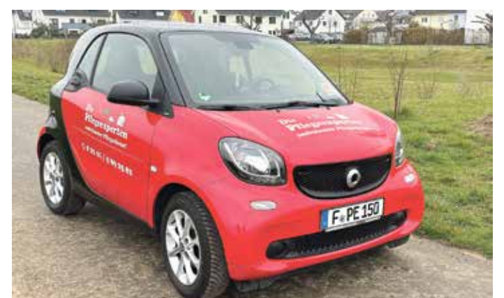
Die Pflegeexperten, Maßbornstraße 37, 60437 Frankfurt.

Maßbornstraße 37 60437 Frankfurt Tel.: 06101 - 9892582 Fax: 06101 - 9892581 e-mail: info@pflege-experten24.de Inhaberin: Renate Wetzol