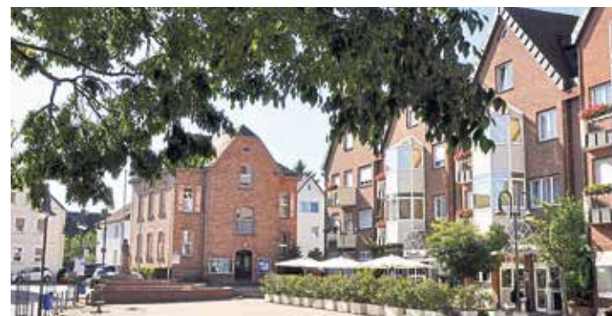
Alter Kirchplatz mit Rathaus und Hotel Harheimer Hof.