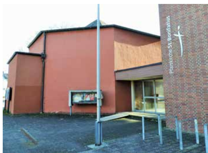
Weitere Infos zur St. Bonifatius Gemeinde findet man unter www.sanktbonifatius.de .

Nach dem Bau der nebenstehenden Pfarrkirche 1966 erfolg-