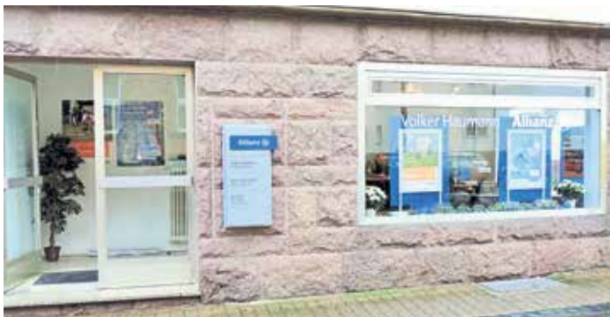
Volker Haumann – Allianz Generalvertretung.