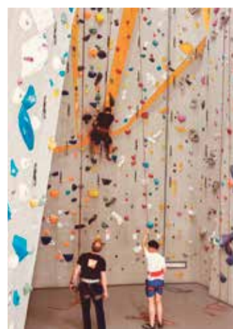
Ein Ausflug führte ins Kletterzentrum nach Preungesheim.

In der ersten Woche stand das Programm ganz im Zeichen kreativer und spielerischer Workshops für die jüngeren Teilnehmerinnen und Teilnehmer. Besonders beliebt war der Zirkus-Workshop, bei dem die Kinder verschiedene Kunststücke einstudierten und ihre Geschicklichkeit sowie ihr Selbstvertrauen stärken konnten. Ebenso sorgte der Fingerfood-Workshop für große Begeisterung: