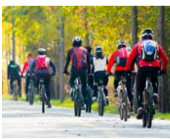
Weitere Informationen findet man online unter www.frankfurt-green-city.stadtradeln.de .