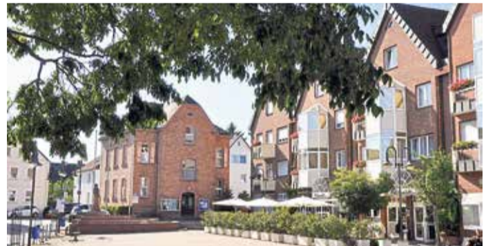
Alter Kirchplatz mit Rathaus und Hotel Harheimer Hof.