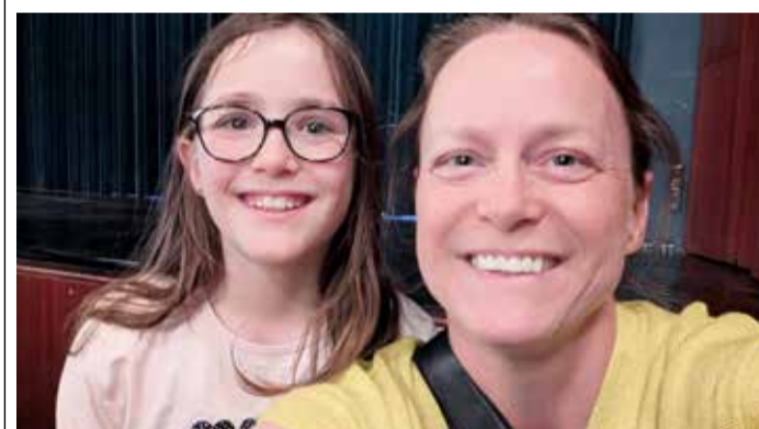
Leuchtende Augen bei der Vorstellung.

LESERBRIEF » Die Gewinner der Februar-Ausgabe