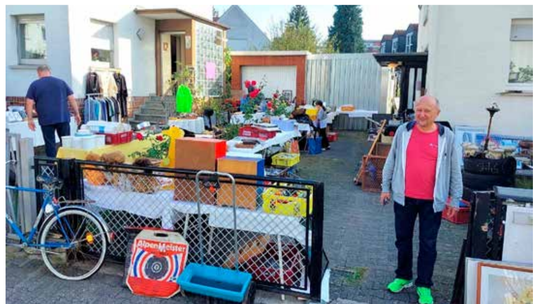
Der Hofflohmarkt lockte bereits im vergangenen Jahr viele Besucher an.

Die Zeit verfliegt wie im Flug und man kann fast in ganz Bonames schätze finden. An dem Tag fühlt es sich so an, als wäre es ein Stadtteilst. Alles ungezwungen