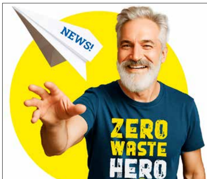
Direkt zum Waste Wettbewerb kommt man über www.zero.waste-bewerb.de/frankfurt .

– Wissen testen, Punkte sammeln und attraktive Preise gewinnen. Wie eine alte Batterie entsorgt wird, nämlich im Einzelhandel oder bei Wertstoffhöfen, das wussten fast alle Teilnehmenden. Viele scheiterten bei der Frage im 10. Level: Wie wird ein kaputter Glastisch entsorgt? Die Antwort lautet: Ein Glastisch kann an den Wertstoffhöfen Nord und West oder bei der Abfallumladeanlage kostenpflichtig entsorgt werden.