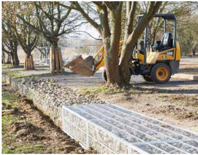
Gabionenband-Erneuerung am Alten Flugplatz.

„Schritt für Schritt wird das Gelände am Alten Flugplatz noch attraktiver für Naherholung und Umweltbildung. Die sanierten Gabionen trennen nun nicht mehr