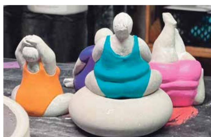
Die Beton-Yogafrauen sind aktuell der Renner.