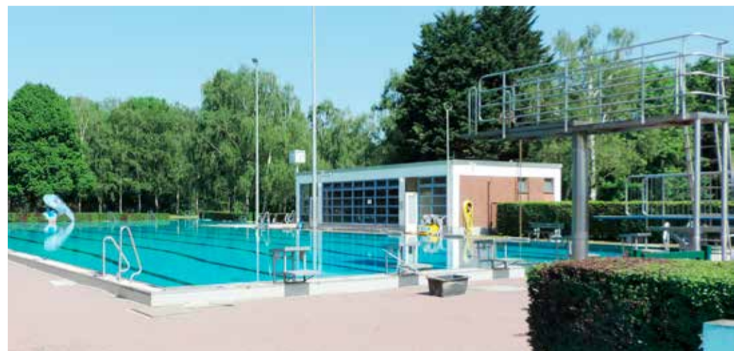
Das Nieder-Eschbacher Freibad in der Heinrich-Becker-Straße 22.

Die neue Broschüre „MAIN Sommerbaden 2026“ bündelt alle Informationen um Öffnungszeiten, Preise, Angebote und Veranstaltungen in den Frankfurter Bädern. Neben den Highlights, wie etwa dem 220-Meter-Becken im Freibad Brentano, der 109-Meter-Röhrenrutsche und dem 10-Meter-Sprungturm im Stadionbad, dürfen sich Badegäste auch auf abwechslungsreiche Events während der Sommermonate freuen. Beispielsweise wird in Kooperation mit dem Verein Tennis'n Beach Rhein-Main ein Beachvolleyball-Turnier im Silobad und im Freibad Brentano, Ferienspaß