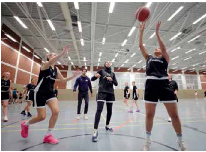
Die Damen-Mannschaft der FTG Frankfurt gewann 2025 einen Trikotsatz.