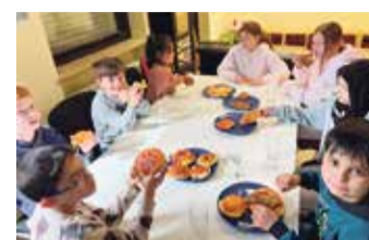
Die Speisen vom Fingerfood-Workshop wurden natürlich gemeinsam gegessen.

Hier konnten die Kinder gemeinsam kleine Snacks zubereiten und dabei spielerisch den Umgang mit Lebensmitteln erlernen. Kreativ wurde es auch im Licht-Kunst-Workshop, bei dem die Teilneh-