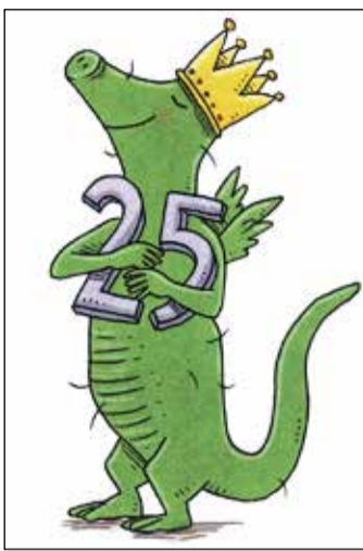
Alles Gute zum Geburtstag, GrünGürtel Tier! Zeichnung: Philip Waechter

Bei Glücksrad, Verlosung oder Quiz dreht sich alles ums GrünGürtel-Tier, einfach mitmachen! Denn es lohnt sich: Neben dem GrünGürtel-Stofftier als Hauptgewinn gibt es zahlreiche andere Preise zu gewinnen. Besondere Highlights sind tierische Freunde des GrünGürtel-Tiers, wie die Schafe von EAT – ErlebnisAcker Taunus. Wer möchte, kann außerdem zusammen mit Philip