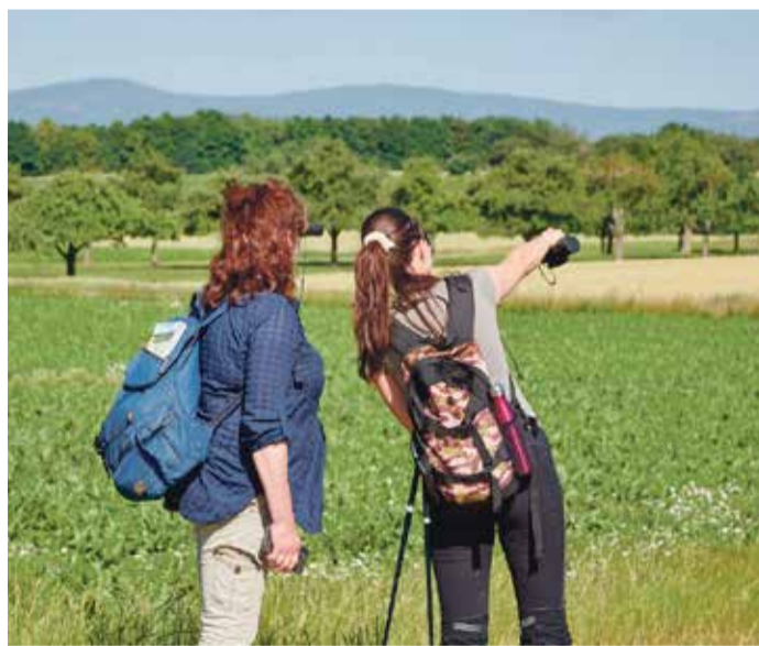
Wandernde mit Outdoor-Apps im Grüngürtel.

Bereits seit zwei Jahren betreibt die Stadt einen offiziellen Account auf der Outdoorplattform Komoot. Pünktlich zum Frühlingsbeginn wird das digitale Angebot nun auf Outdooractive über einen